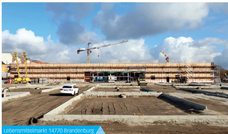
Lebensmittelmarkt 14770 Brandenburg