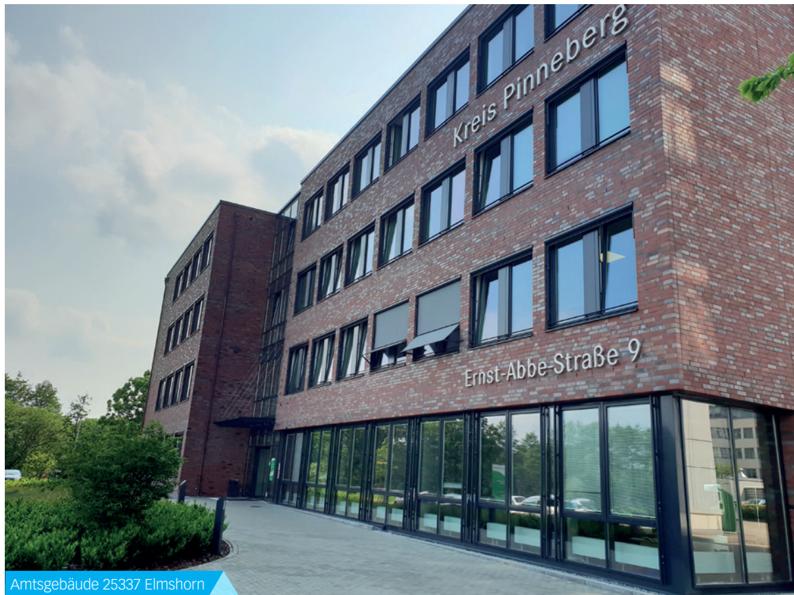
Amtsgebäude 25337 Elmshorn