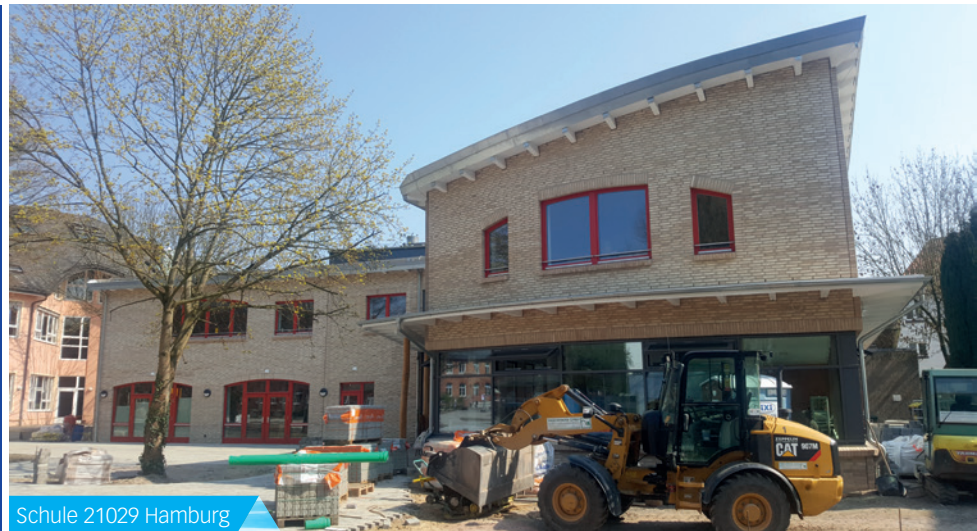
Schule 21029 Hamburg

Bei der Betreuung unserer Bauvorhaben - sei es eine einfache Kellersanierung oder ein komplexes Großprojekt - agieren wir im Sinne unserer Kunden. Kundenzufriedenheit ist bei uns eine Investition in die Zukunft, was unsere langjährigen Kundenbeziehungen belegen.