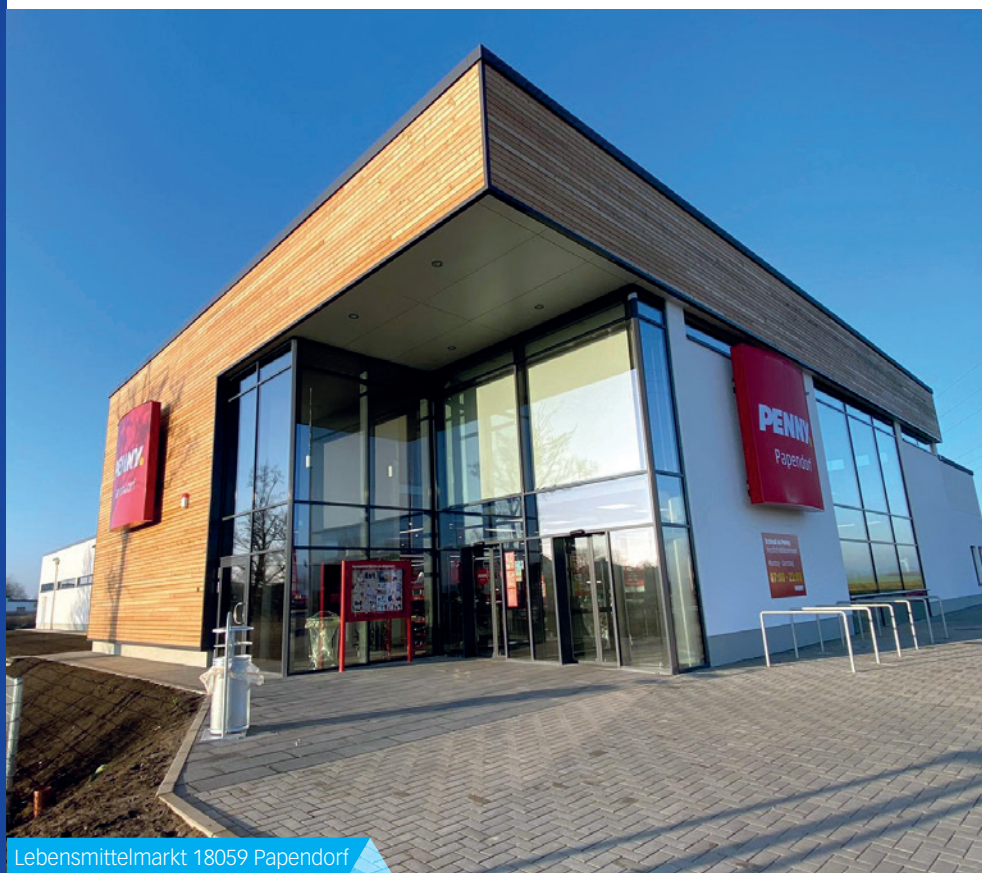
Lebensmittelmarkt 18059 Papendorf