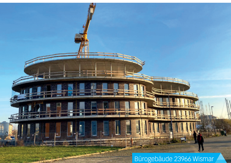
Bürogebäude 23966 Wismar